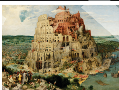
Wieża Babel, obraz Pietera Bruegla (starszego)