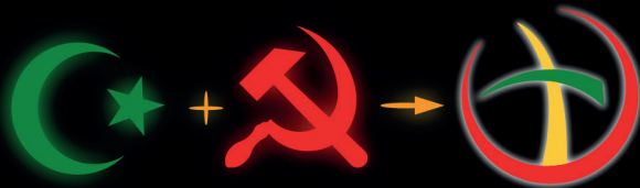
Logo papieskiej pielgrzymki do Maroka, marzec 2019

Zjednoczenie wszystkich religii realizowane na naszych oczach przez papieża Franciszka: