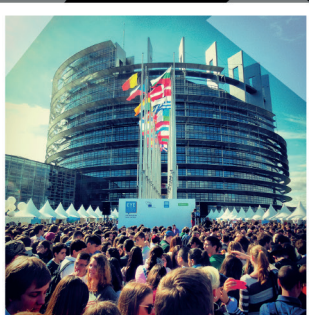
Parlament Europejski, Strasburg

Dowodem niech będzie architektura Parlamentu Europejskiego wzorowana na wieży Babel: